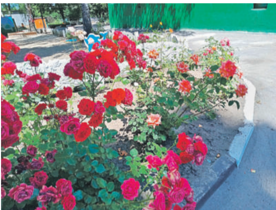
Детсад № 48 «Вишенка» г. Белгорода