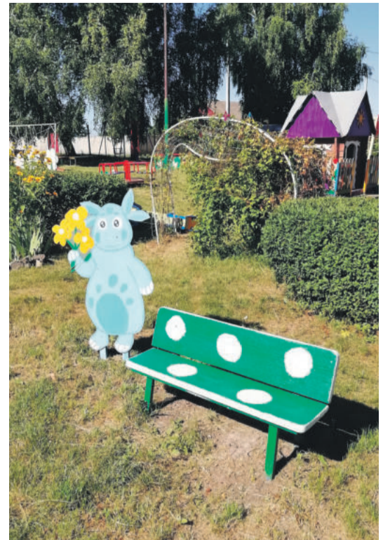
Детсад № 4 с. Алексеевка Корочанского района