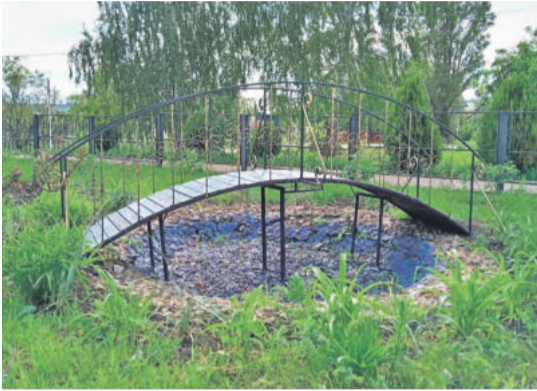
Уразовская школа № 2 Валуйского городского округа