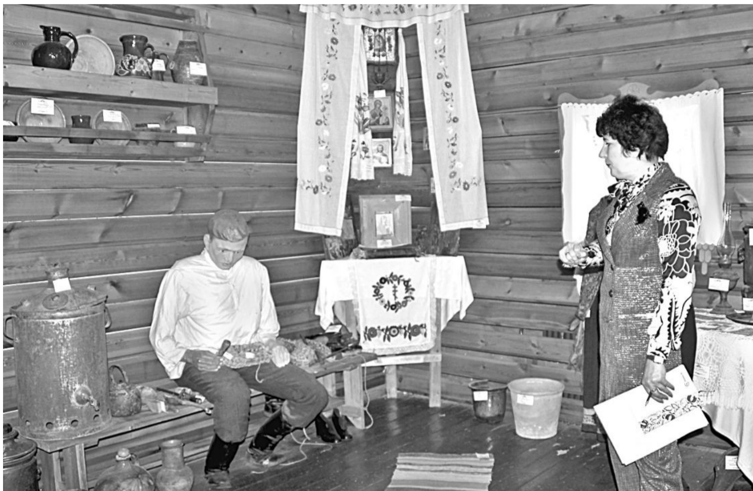
В школьном музее этнографии

НО ДАЖЕ САМОЕ КРАСИВОЕ, ПУСТЬ И ДОБРОЖЕЛАТЕЛЬНОЕ ОФОРМЛЕНИЕ МОЖЕТ СТАТЬ БЕСПОЛЕЗНЫМ, БЕЗДЕЙСТВЕННЫМ,