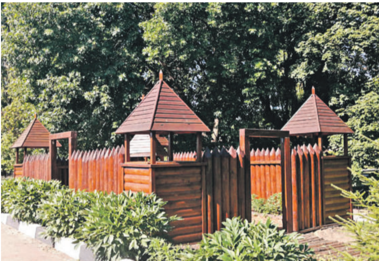
Школа № 4 г. Валуйки

Школа начинается со школьного двора. От того, как он обустроен, зависит многое. Настроение ребят и учителей. Их желание идти в школу. Адаптация первоклассников к учебной жизни. Недаром на Белгородчине уже много лет проводят конкурсы на лучшее обустройство школьных территорий. Если к делу подойти с душой, то школьный двор можно превратить и в ботанический сад, и в сказочный сад, и в обучающее пространство. В группе «Доброжелательная школа Белогорья» в соцсети «ВКонтакте» мы попросили учителей и учеников поделиться с редакцией фотографиями дворов их школ. И детских садов. Давайте вместе полюбуемся на нашу школьную красоту! Ну и в нашем редакционном портфеле кое-что нашлось.