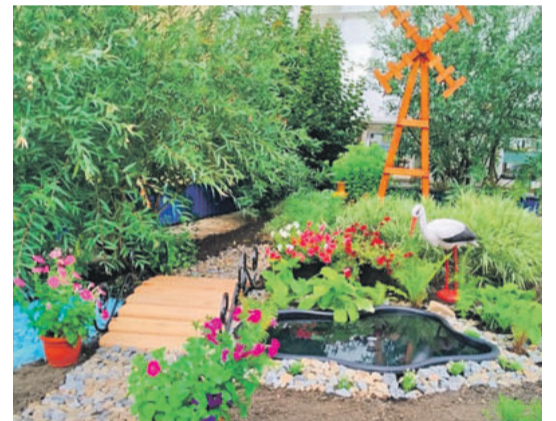
Рождественская школа Валуйского городского округа