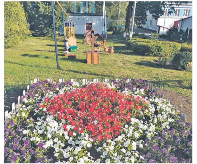
Старобезгинская школа Новооскольского городского округа