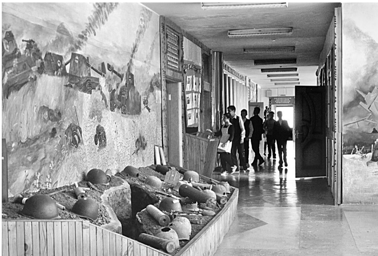
Школьный музей Великой Отчужденной войны