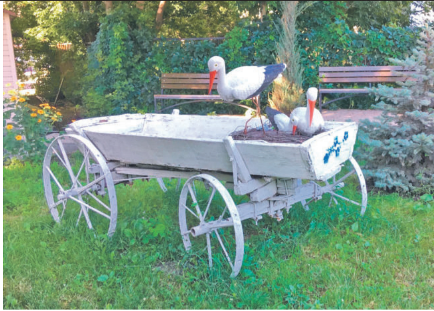
Центр образования № 1 г. Белгорода